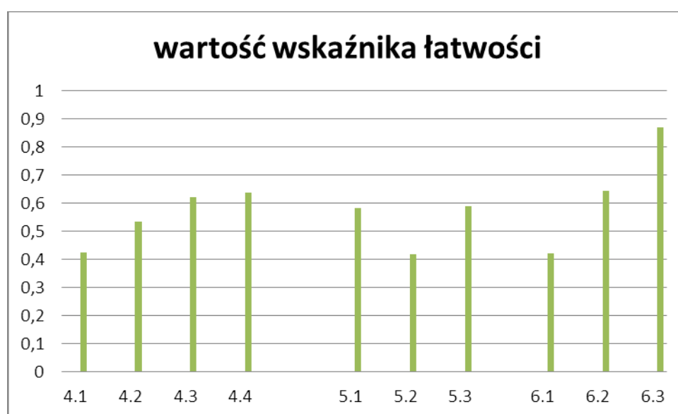
Wykres 3. Wartości wskaźnika łatwości zdaniach sprawdzających znajomość funkcji językowych

Najłatwiejsze z danej umiejętności okazało się zadanie 6.3., zaś najtrudniejsze zadania 4.1., 5.2. i 6.1.