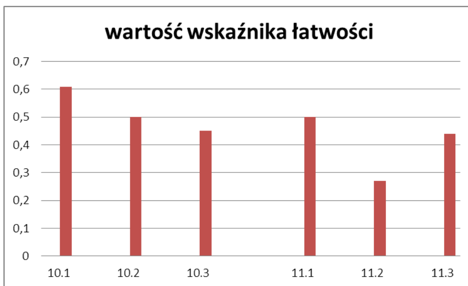
Wykres 5 wartości wskaźnika łatwości zdaniach sprawdzających znajomość środków językowych.

Podsumowując, można powiedzieć, że zdający dość dobrze opanowali większość umiejętności przedstawionych standardach wymagań. Parametry statystyczne arkusza dla uczniów szkół województwa kujawsko-pomorskiego są przedstawione poniżej.