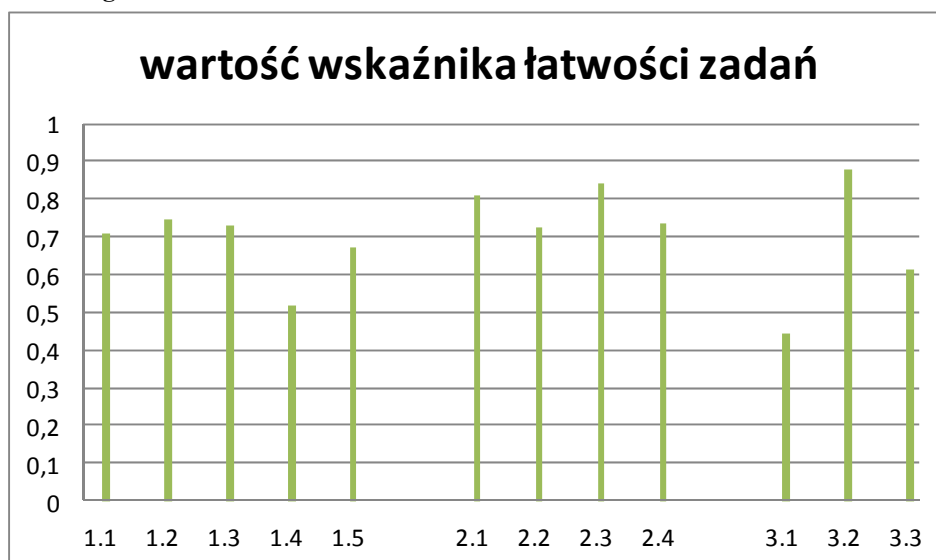
Wykres 2. Wartości wskaźnika łatwości poszczególnych zadań badających umiejętność odbioru tekstu słuchanego

Najłatwiejsze z danej umiejętności okazało się zadanie 3.2., zaś najtrudniejsze zadania 1.4. i 3.1.