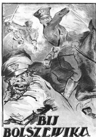
Polski plakat propagandowy z 1920 roku