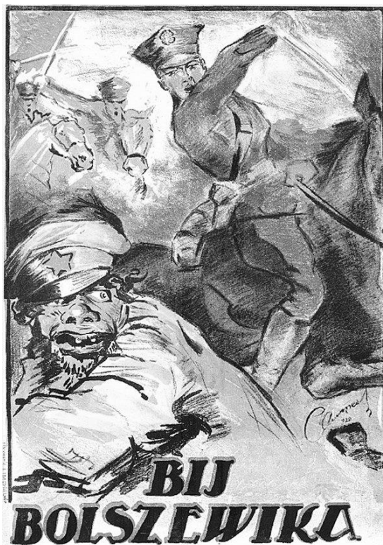
Polski plakat propagandowy z 1920 roku