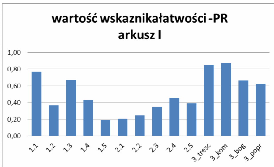
Wykres 2. Wartości wskaźnika łatwości zadań z części I arkusza z poziomu rozszerzonego w województwie kujawsko-pomorskim

W tym roku temat ten nie cieszył się dużym zainteresowaniem młodzieży. Uczniowie, jak co roku, mają problemy z odróżnieniem formy opisu i opowiadania. Pojawiały się opowiadania na temat imprezy z niepełnosprawnymi sportowcami w tle. Ponadto część uczniów miała kłopot z opisaniem imprezy z osobami niepełnosprawnymi. W większości opisów uczestnikami imprezy opisywanej przez uczniów były osoby pełnosprawne, a widzami osoby niepełnosprawne.