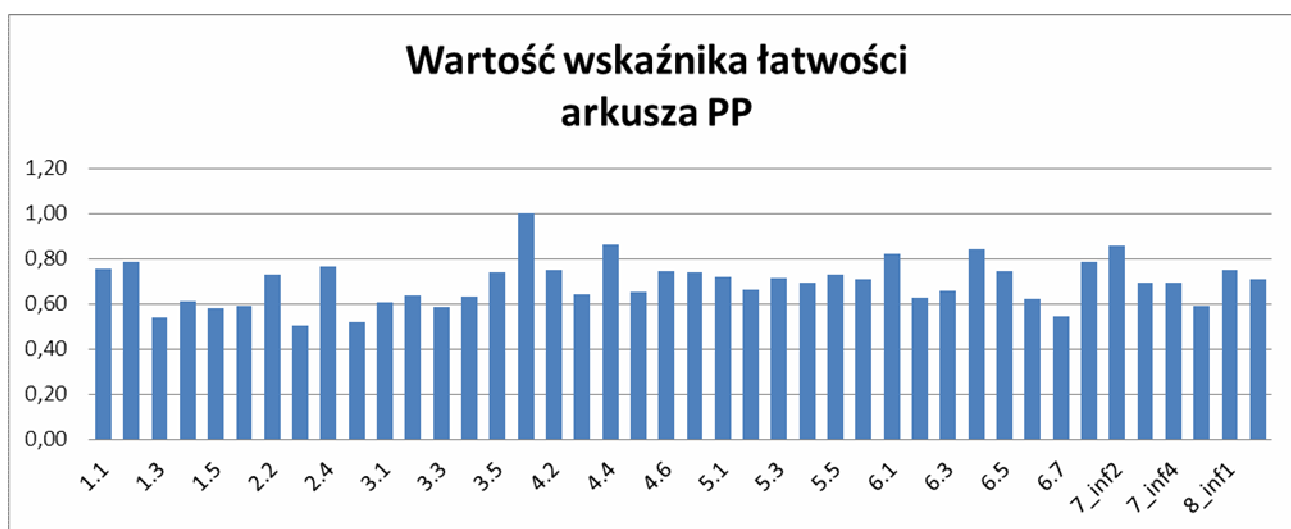
Wykres 1. Wartości wskaźnika łatwości wykonania powyżej omówionych zadań w województwie kujawsko-pomorskim.